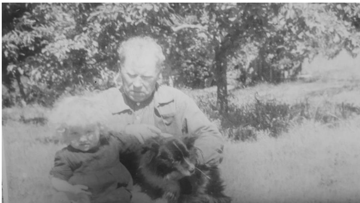
Isa ja koer Riksiga pere õunaaias. 1955. aasta suvi

Ja kui palju oli suviti maasikaid! Meil olid naabrilastega oma kindlad maasikakohad, kus kunagi ilma ei jäänud. Karjamaal olid ju ainult kadakad, seas mõni üksik lehtpuu või mänd. Lagedat rohumaad oli palju. Põllud olid väikesed, puuderibad vahel ja põlluääred maasikaid täis. Suuremad põllud tehti maaparandustöödega umbes 1970. aasta paiku.