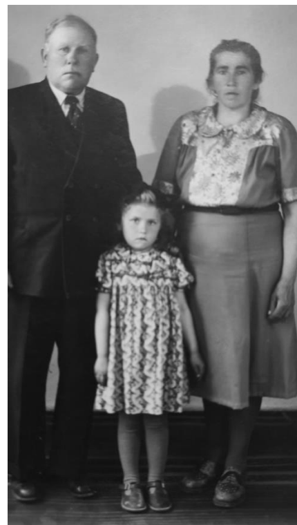
Ema ja isaga. 1950. aastate lõpp

rannakarjamaad läbi käia, aga lapselapsed enam ei saa.