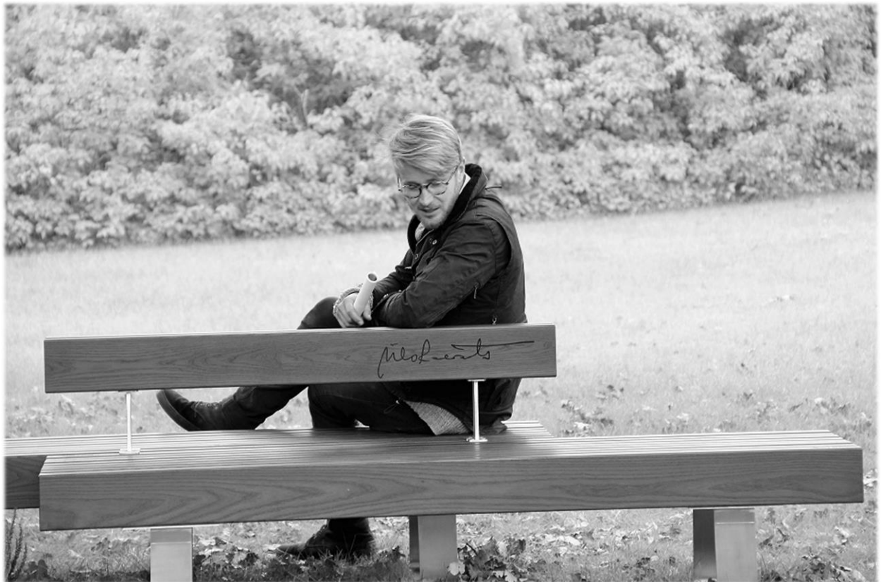
Isa ja poeg.

30. septembril avati Kassari muuseumimaja õuel tamme all mälestuspink Ülo Kaevatsile.