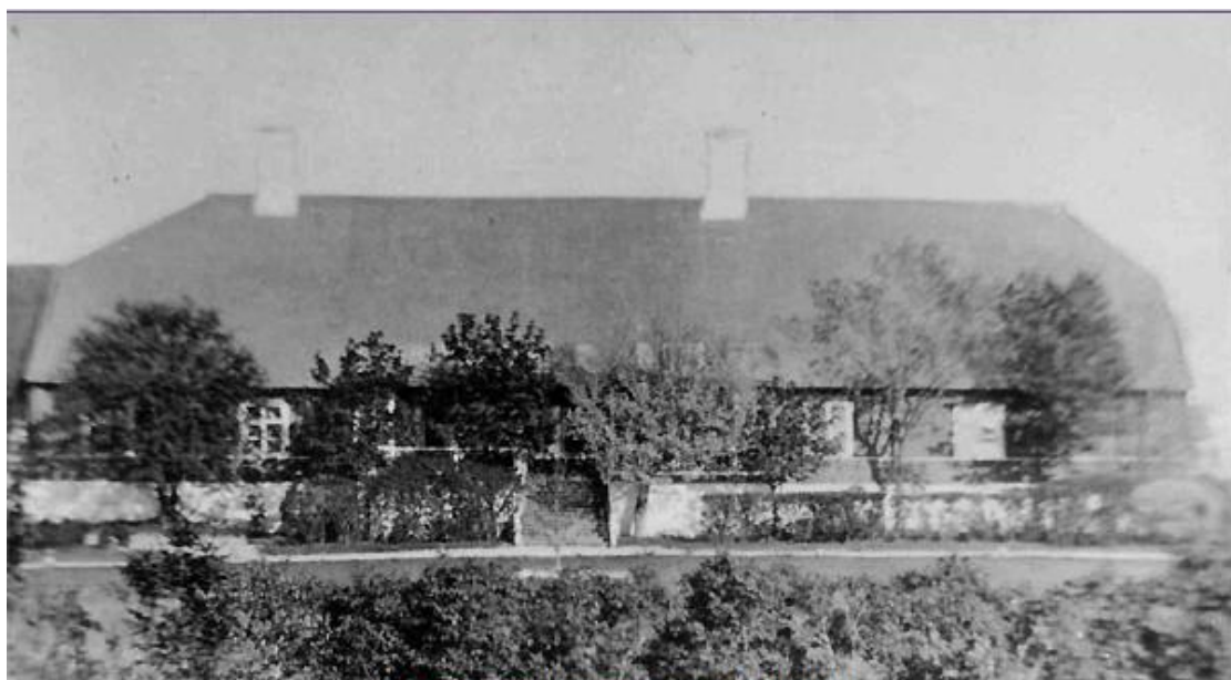
Kassari mõisa peahoone (hävinud)

Underi vanaisa). Kultuurilistest üritustest olen kuulnud oma emalt, et ta oma õdede ja vendadega neiupeõlves mitmetes näitemängudes mängis. Sel ajal olnus seltsimaja Kärneri maja ja mõisa häärberi vahel. Üldse olnud kultuurielu mõisa poolt väga soosiv.