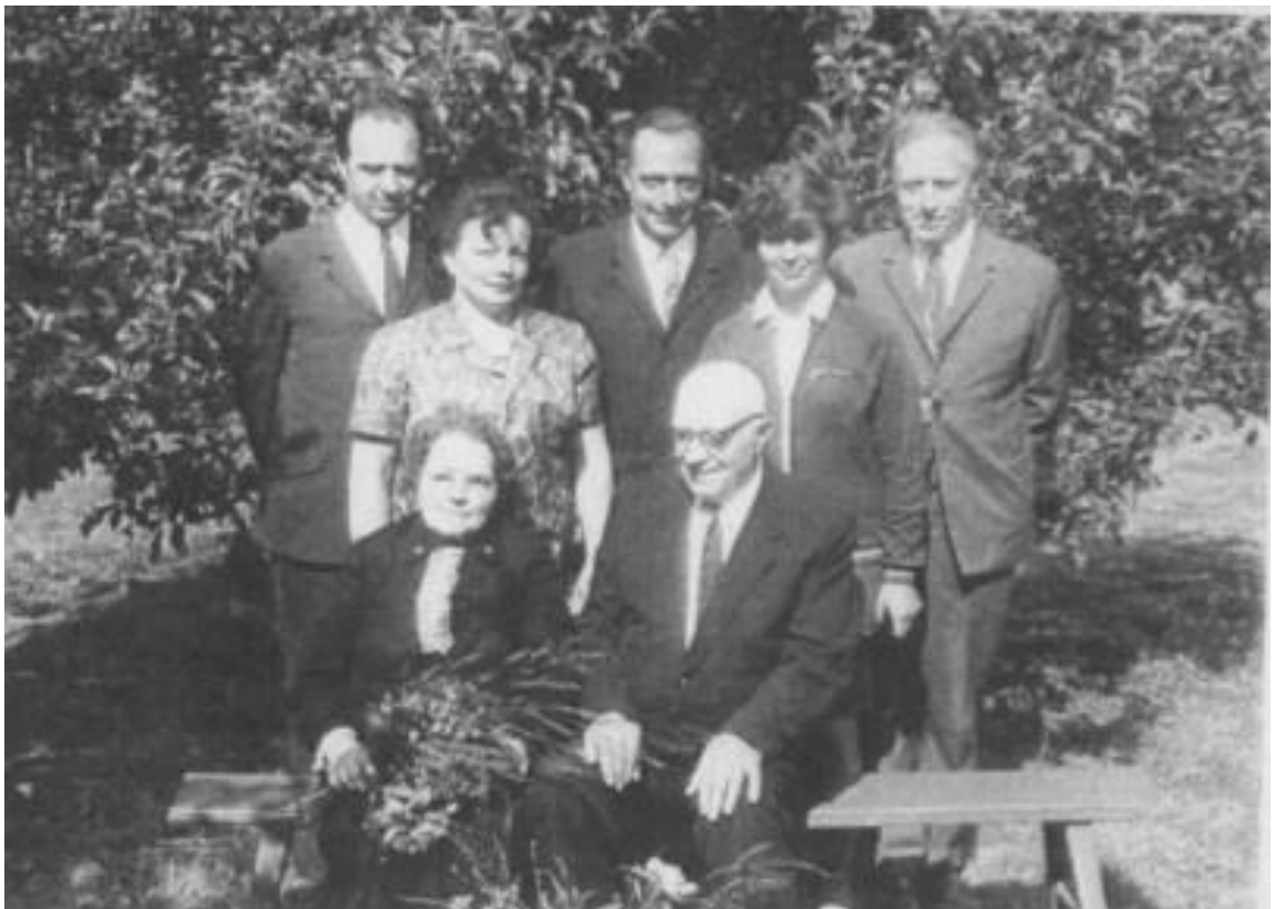
1971.a tehtud perekonnapilt vanemate kuldpulma päeval