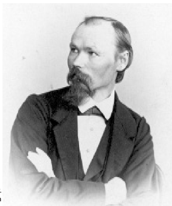
Johann Köler. Wikipedia

Kirjutanud Aino Kallas „Olion“ nr 8 (tekst vanas kirjas) HKM R1624