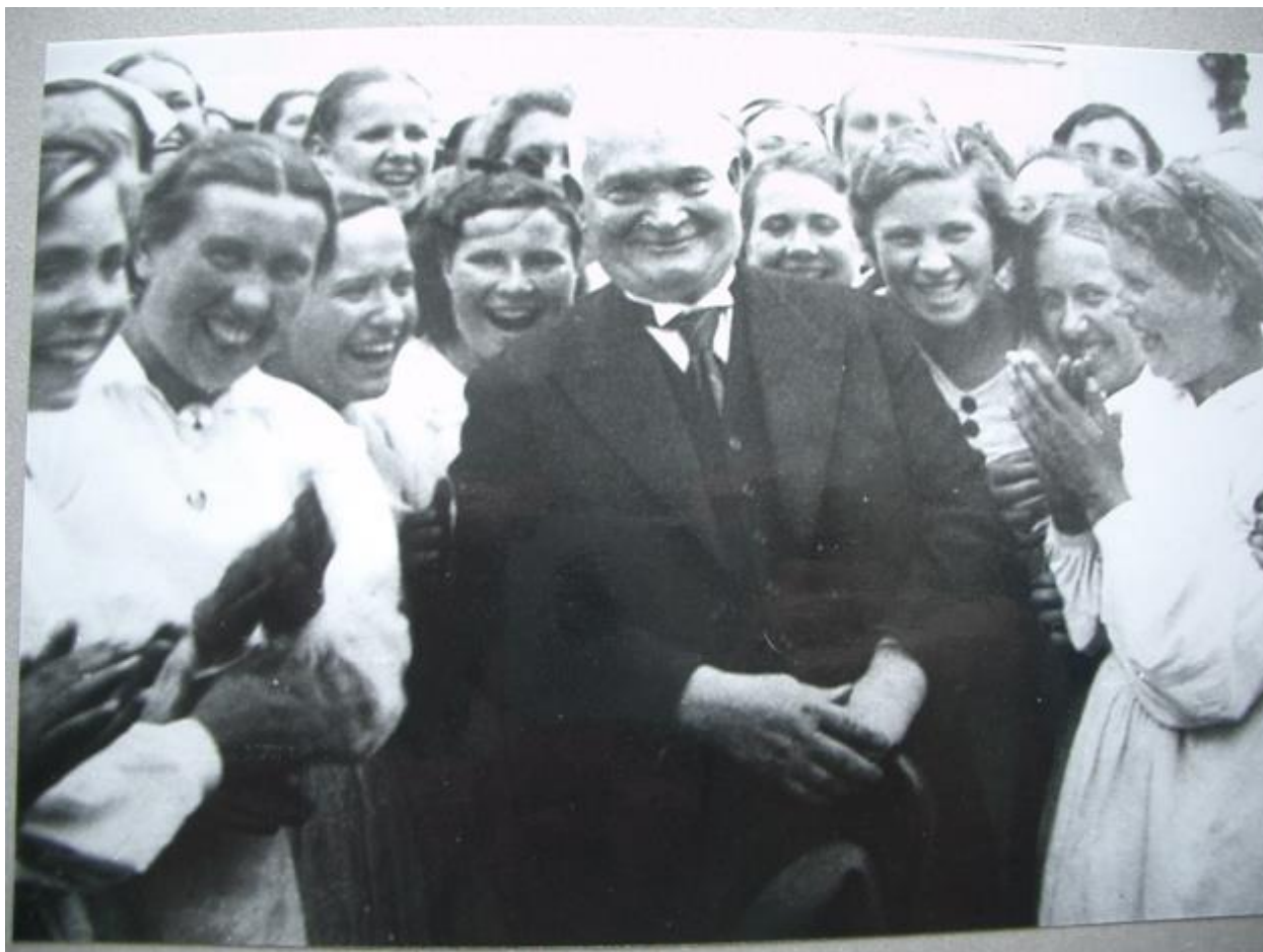
Konstantin Päts Hiiumaal

Hiljem on Hiiumaal käinud presidendid Lennart Meri, Arnold Rüütel ja Toomas Hendrik Ilves.