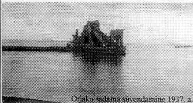
Orjaku sadama süvendamine 1937. a.

Käesolevas muutuv ühiskonnas on suurel osale elanikele elu raske, eriti seda maal. Meil Kassari Orjaku saarel seda eriti, oleme arvestatav ääremaa. Ei ole meil kooli ega koolimajagi, ei sideasutust, kust saaks ajalehti tellida, ega järjest suurenevaid maksusi tasuda. Ei ole sobivat autobussi ühendust, et saaks vähem kui terve päevaga neid toiminguid tegemas käia. Aga elada tahame